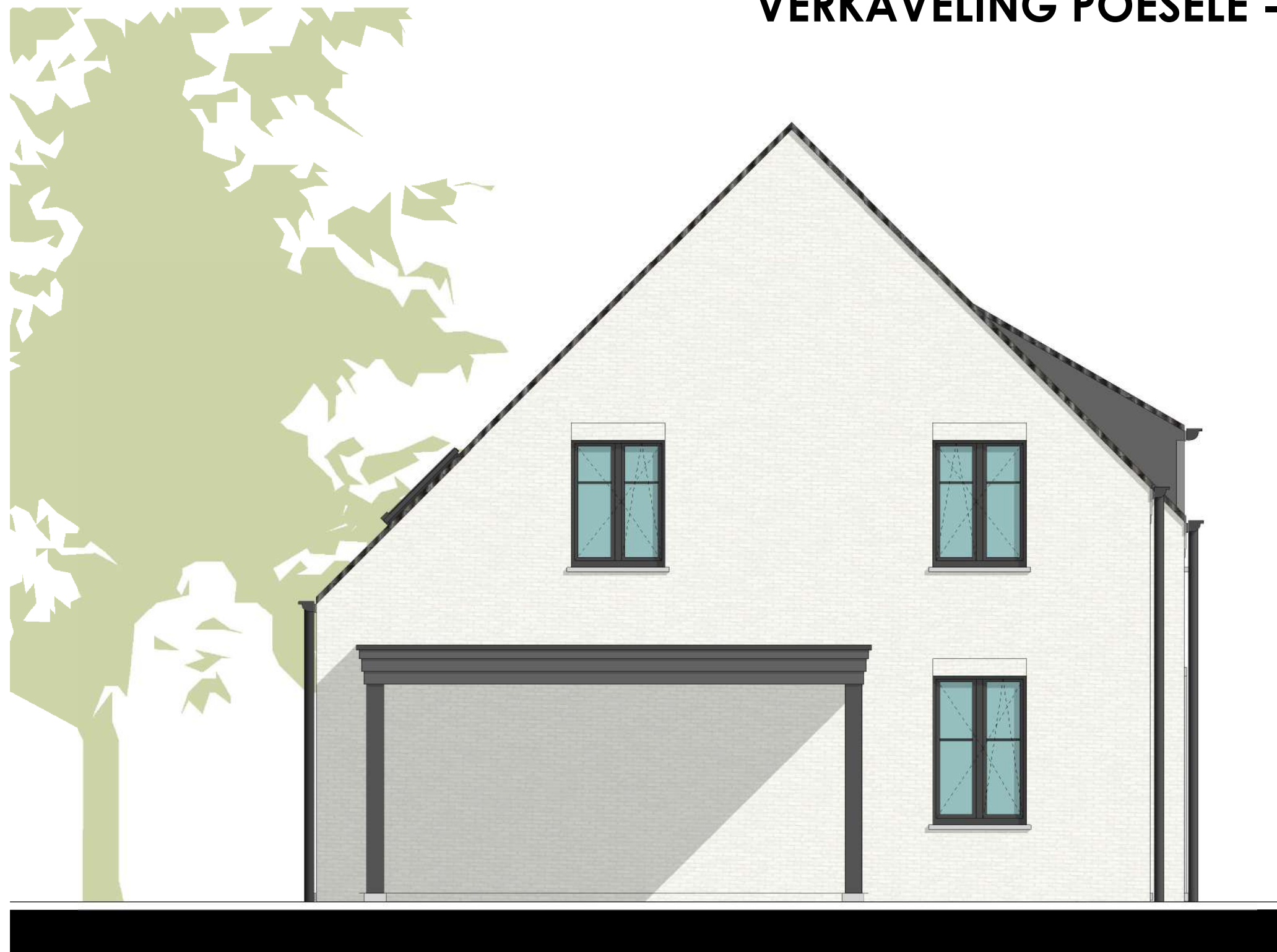
LINKERZIJGEVEL LOT 19