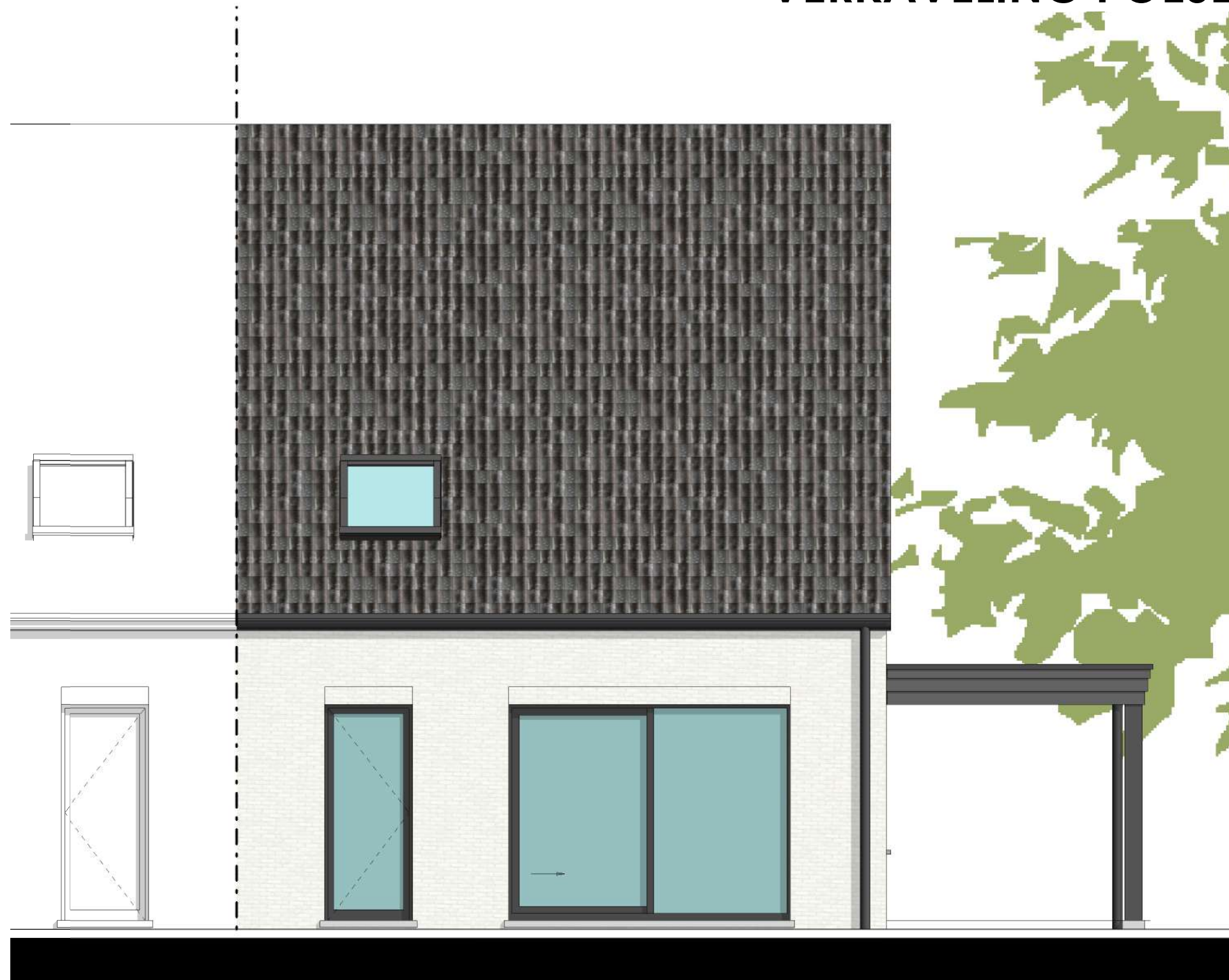
ACHTERGEVEL LOT 19